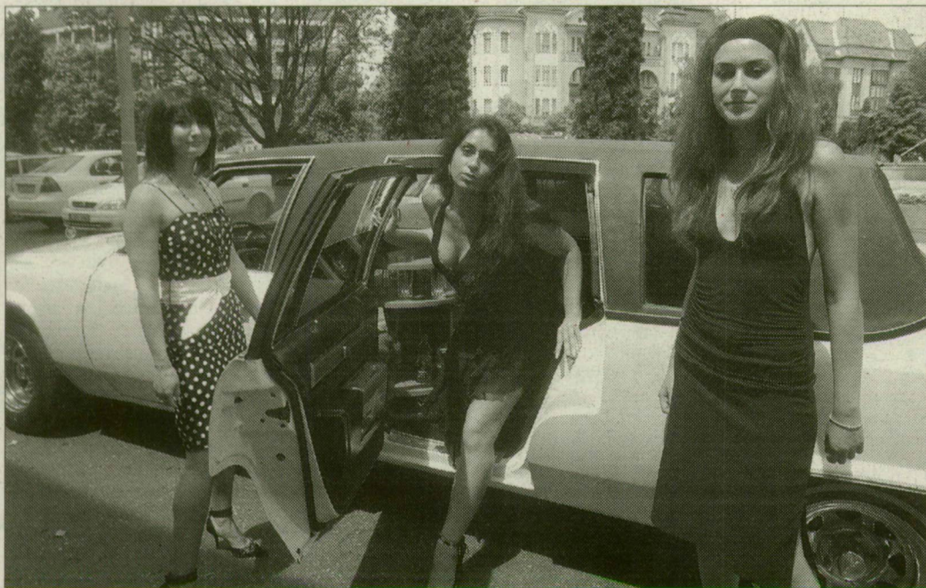
Ők biztosan beneveznek a versenyre

A szépségversenyekre a nevezés díjtalan, és tizenkilenc év felett péntek éjfélig bárki jelentkezhet.