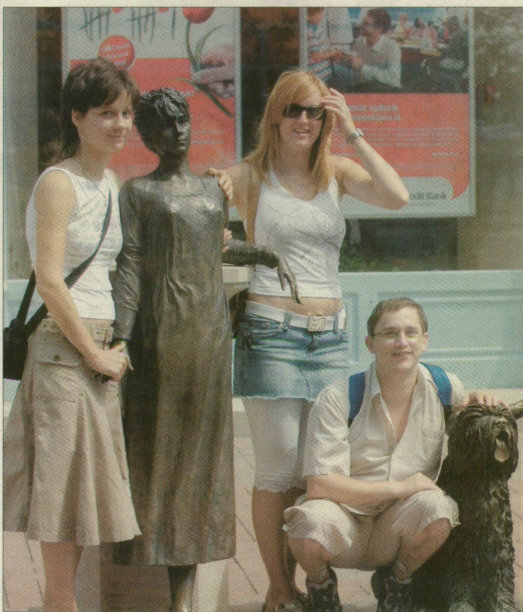
B. B. A. Ha több a nő, mint a férfi

A Központi Statisztikai Hivatal szegedi kirendeltségének adatai szerint 228-cal több fiú születik, mint lány. Tavaly 3917 fiú és 3689 lány látta meg a napvilágot Szegeden. Az erősebbnek nevezett nem számbeli fölénye a népesség 20. életévéig tart, azt követően egyre inkább túlsúlyba kerülnek a nők. A húsz és huszonnégy évesek között a nők már 510-zel többen vannak. Az eltérés mindenképp az asszonyok magasabb átlagéletkorára vezethető vissza. Az 55-től 59 évesek között 1527-tel több nő van. Szegeden a száz férfira jutó nők aránya átlagosan 118 fő. Ezzel a számmal az országos lista második helyén állunk, hiszen csak Budapest előz meg bennünket, ahol száz férfira 119 nő jut.