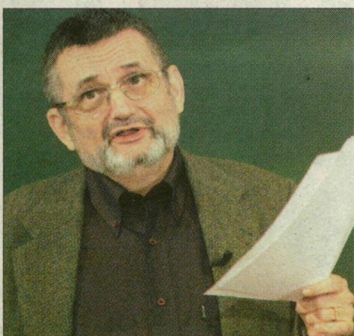
Lehet az ember jó tulajdonságaira számítani – mondja Csányi Vilmos professzor

– Hogy merrefelé halad a világ, nem tudjuk megmondani: nulla távolságban van a jövőhorizont – mondja. Még azt sem tudjuk előre jelezni, öt-tíz-húsz év múlva mi lesz, hát még hosszabb távon. A technikai evolúció rendkívül gyors, aki ilyen körülmények között jóslni mer, az vagy nem ért hozzá, vagy szándékosan félre akarja vezetni az embert. Az emberiség lélekszáma jelenleg hatmilliárd, tegnap legalábbis még ennyi volt; az a rendszer, amit ekkora tömeg működtet, kívánságainktól, sőt tudatunktól függetlenül működik. Azonban az emberi népességnek valószínűleg létezik bizonyos önszabályozó képessége, s ez alapján elkerülhető az összeomlás. Itt van például az atomfenyegetés ügye, ami