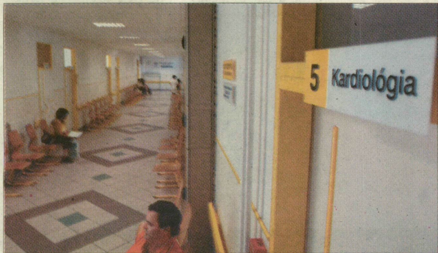
A kardiológiára talán már másnap bejutunk, de ha kicsi a baj, két és fél hónapot is várhatunk az alaposabb kivizsgálásra