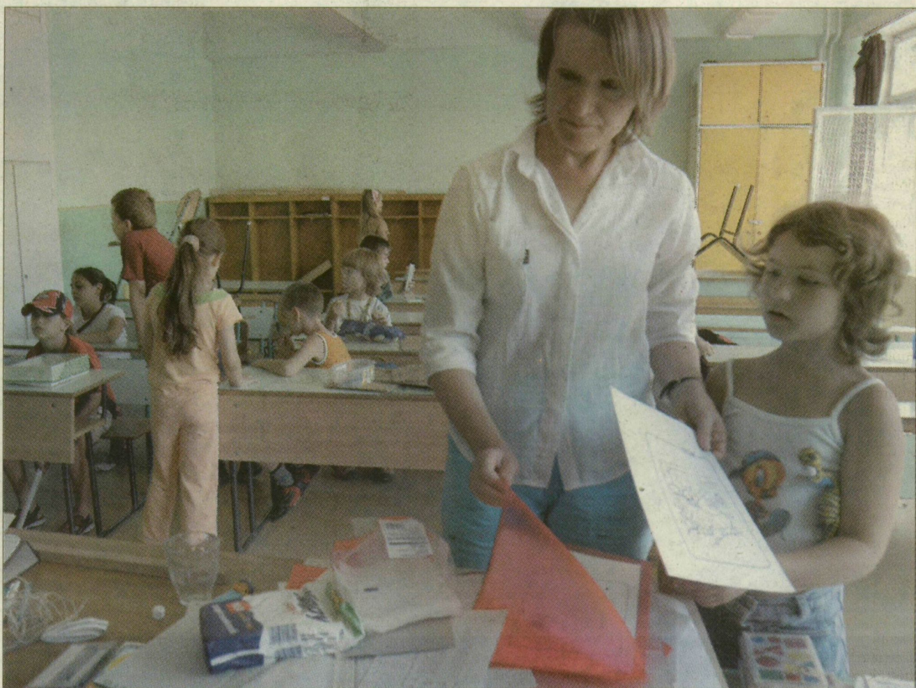
A múlt hét vége óta szortíroznak a Kodály téri iskolában, amelyet július 1-jéig ki kell üríteni