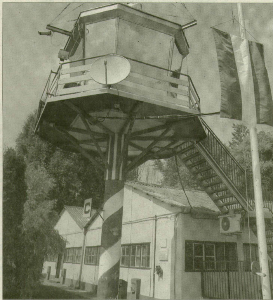
Az irányítótoronyt és a parancsnoki épületet a város és a repülőtér üzemeltetője használhatja