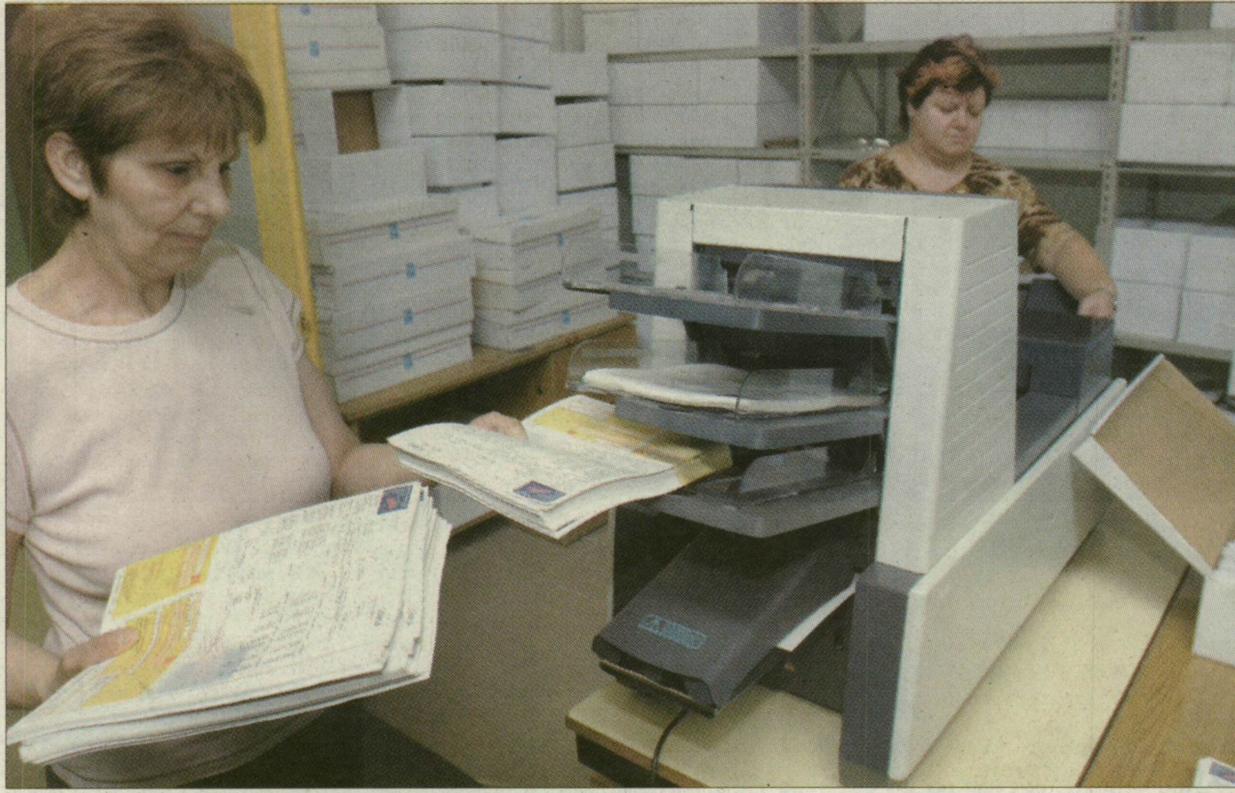
Készülnek a számlák. A SzeHő a hónap végéig kiküldi az elszámolásokat a szegedieknek