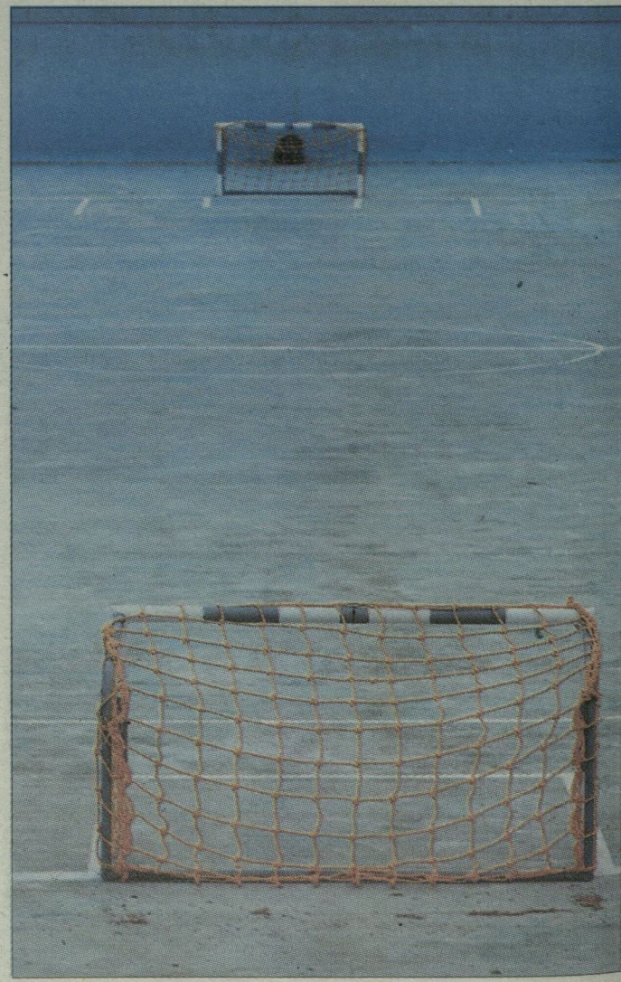
Üres a Partfürdő medencéje, focizni lehet benne

Az ötvenméteres betonos úszómedencéből futballpályát, dűhögöt alakítottak ki.