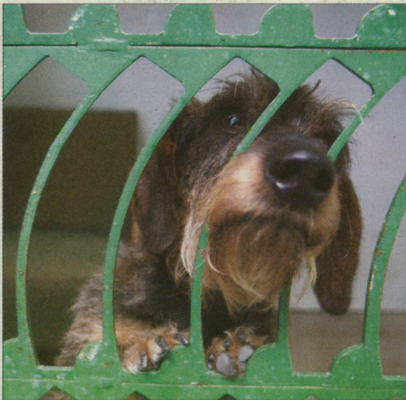
A panzióban sem ritka vendég a honvagy

– Minden nyáron, amikor hosszabb időre elutazunk, beadjuk Zsinórt a szegedi kutyapanzióba. Kezdetben még megpróbáltuk magunkkal vinni. Jól tőrt a 22 órás görögországi utat, szinte végig aludt, de a nyaralás már kinszen-