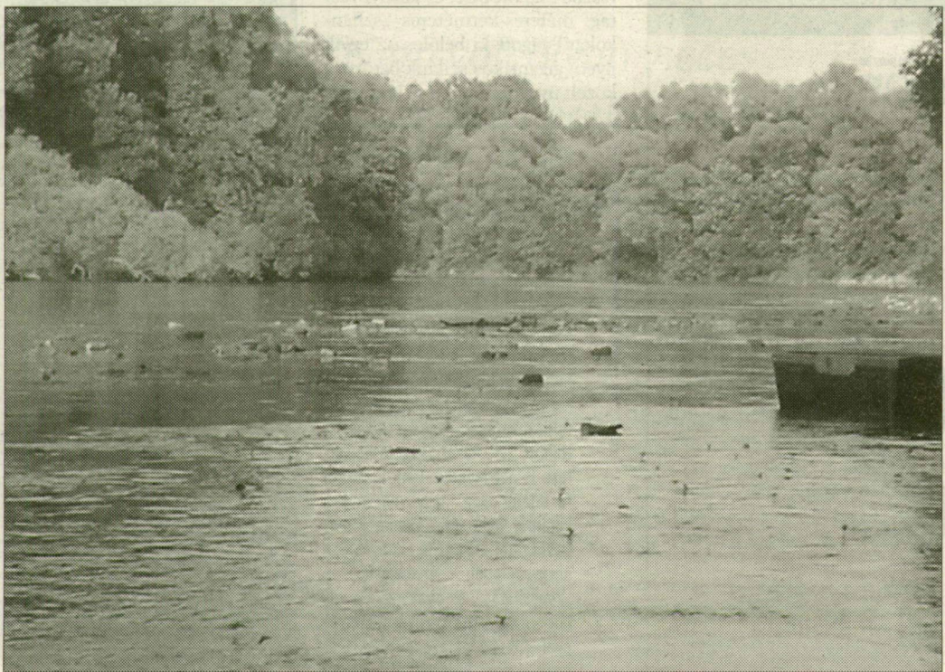
Ez a kép fogadta Ferencszállásnál azokat, akik a napokban a folyóparton sétáltak