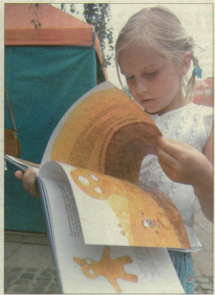
Piller Mimi kedvence a Bogyó és Babóca