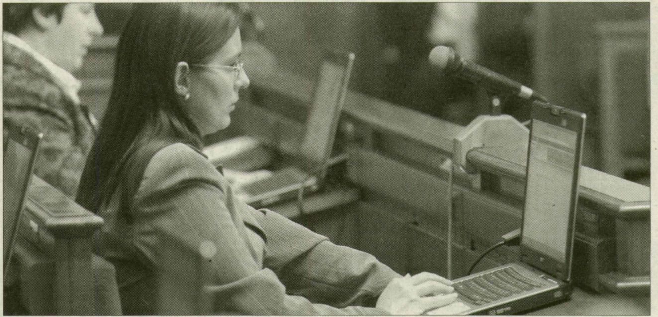
Vásárhelyen már elektronikus információkkal, laptopon dolgozhatnak a képviselők

A szakemberek több variációt vázoltak. E szerint az adattovábbítás történhetne pendrive segítségével, CD-n vagy elektronikus levélben, esetleg a képviselők letölthetnék a közgyűlési anyagot a város honlapjáról is. Az informatikusok számítása szerint a pendrive jár a legnagyobb, az elektronikus levél és a honlap pedig a legkisebb költséggel, ugyanakkor mind közül az e-mail biztonsági kockázata a legmagasabb. Az előterjesztésben nagy hangsúlyt