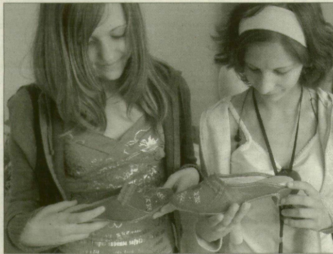
A papucsmúzeumba is látogattak az iskola tanulói