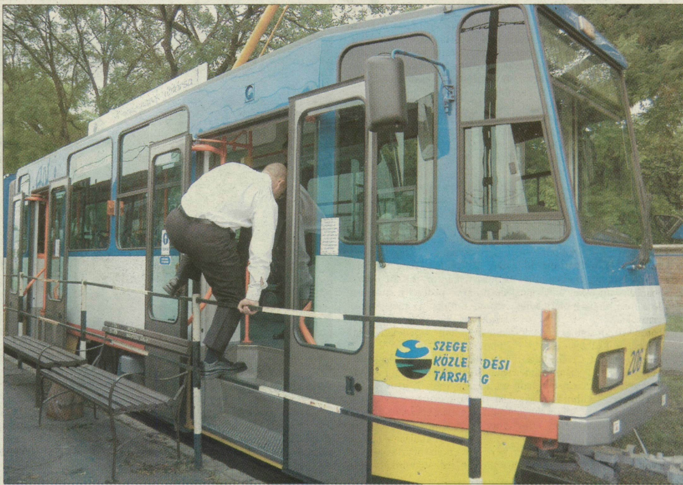
Egy felkészült villamosvezető előtt nincs akadály