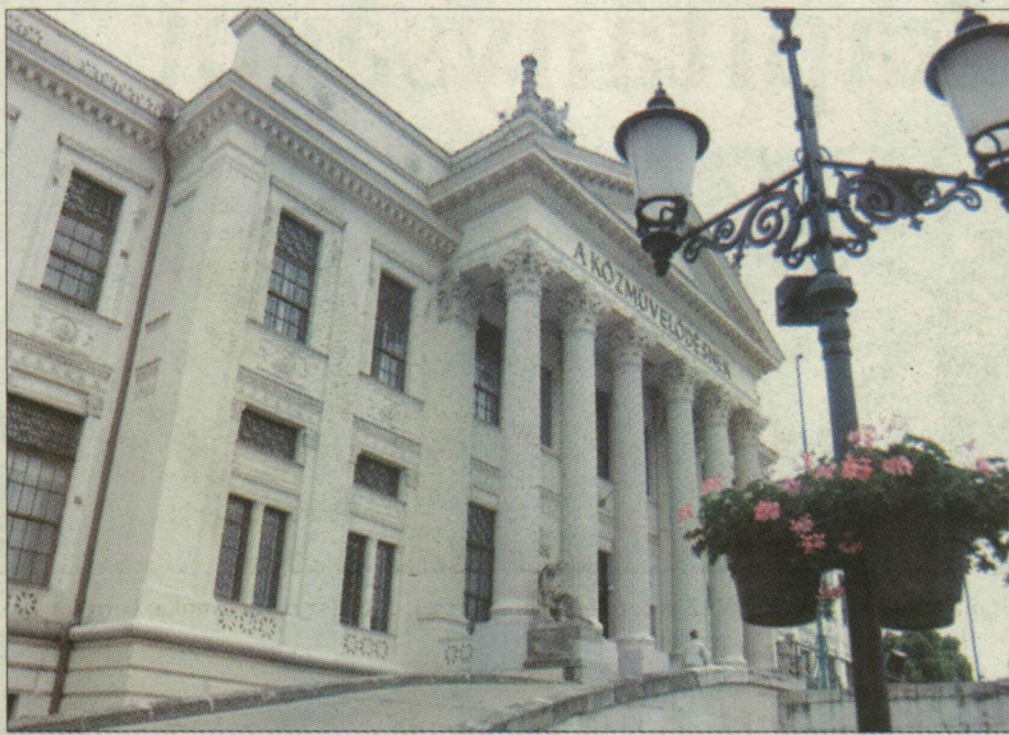
A felújítást hamarosan Rodin és Renoir munkáinak kiállításával ünneplik.