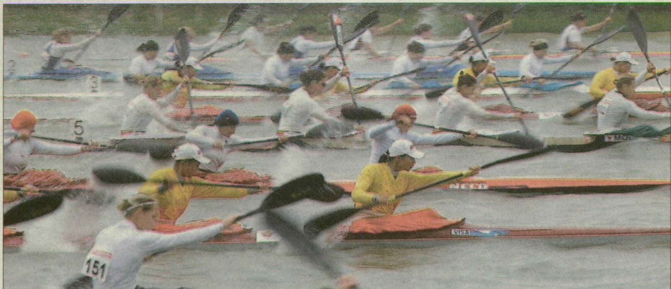
Tíz döntőt rendeztek a kajak-kenu Világkupa első napján