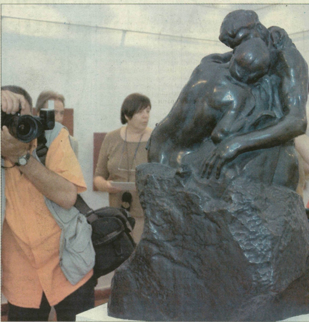
A nevezetes Rodin-szobrot tegnap állították ki a szegedi Fekete Házban

– A csók létezik bronz, márvány és gipsz változatban, többféle méretben is. A bronzmások igen elterjedtek, mert Rodin még életében átengedte a szobrá-