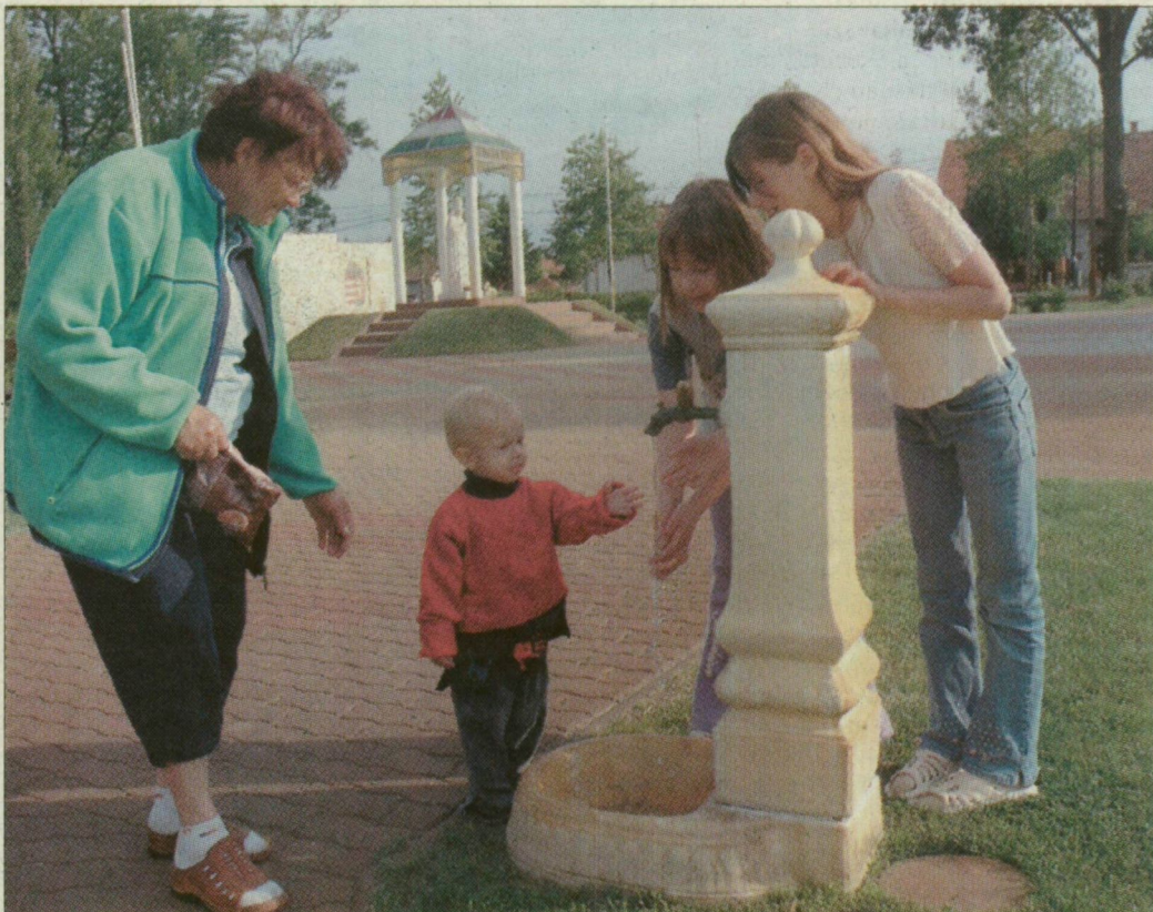
A falu központján meglátszik, hogy a helybeliek igényesek környezetükre

Az itt élők büszkéek a szabadidő- és sportcentrumra is, amely méltó helyszíne a megye I. osztályú ásotthalmi focicsapat mérkőzéseinek. A településen sok a civil szervezet, ezek együttműködnek az önkormányzattal, sok esetben közösen pályáznak a település vezetésével. A polgár-