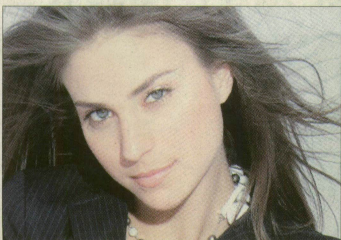
Portré a portfólióból

– Tizennégy évesen hatalmas élmény volt az ötnapos verseny, amelyet egy fergeteges buli követett Albert herceg társaságában. Hazaérkezésem után a fővárosban voltak munkáim, de mint minden más szakmában, az ember ebben is fejlődni szeretne, ezért döntöttem úgy, hogy külföldön is szerencsét próbálok – mondja a céltudatos lány. Három hónapot töltött Szöulban, ahol modelltársaival együtt kirá-