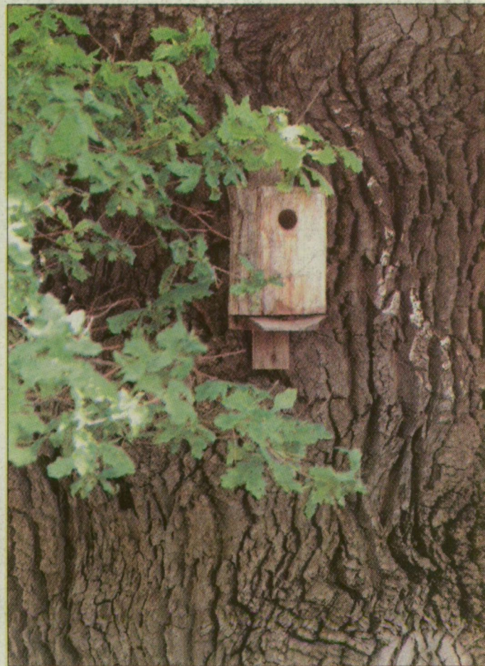
Kis odú nagy fán

Vegyes átlagfogyasztás: 4,7-9,3 l/100 km, CO 2 -kibocsátás: 124-224 g/km