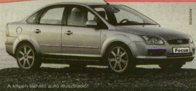
A képen látható autó illusztráció!

A Ford Focus megjelenése óta nemcsak a szakemberek legmagasabb elismerését vívta ki, de kényelmével és kimagasló vezetési élményével még a legigényesebb vásárlók számára is tartogat kellemes meglepetéseket. Győződjön meg róla Ön is!