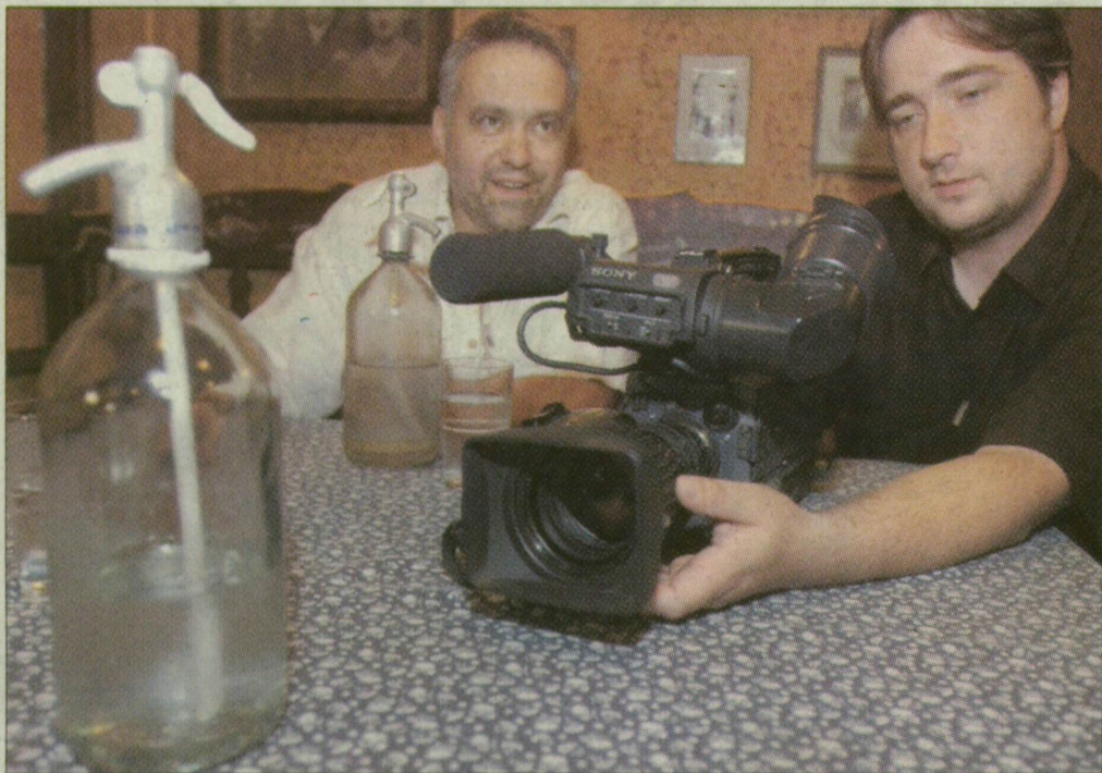
Az alkotók és a téma