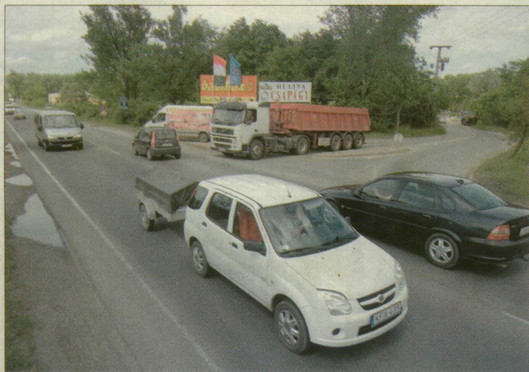
A Szőregi út és a Thökölly utca kereszteződése. Ma eldől, lesz-e itt körforgalom

Benzinkút, bolt, és két új körforgalom épülhet a Szőregi úton egy magáncég közreműködésével. Egyik a Thökölly, a másik a Diófa utcai kereszteződésnél. A közgyűlés ma dönt a javaslatról.