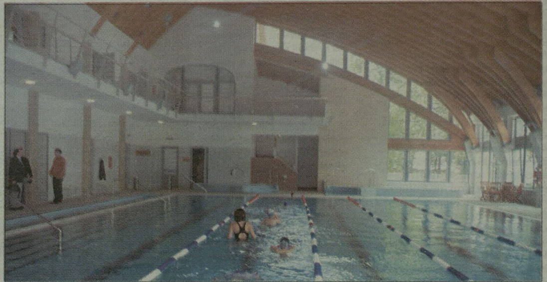
Az apátfalvi gyerekek vidáman lubickoltak az új medencében