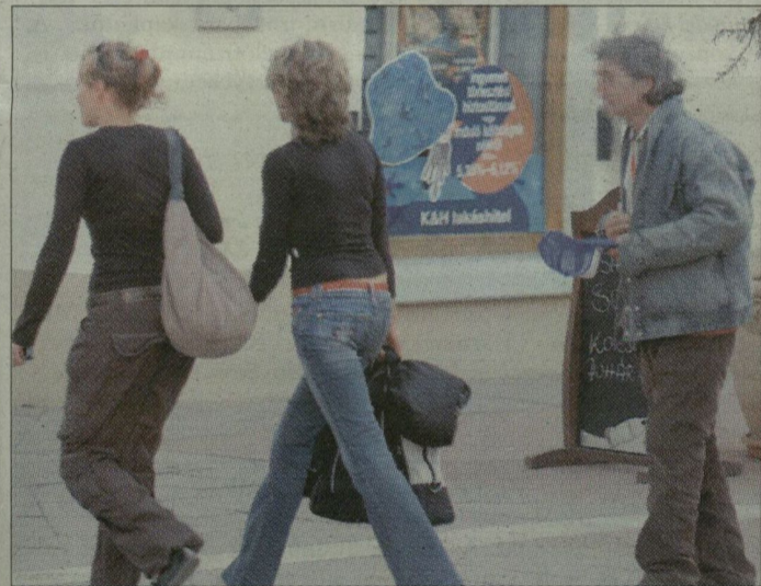
Egy a sok közül: kolduló férfi a Kárász utcán

– A rendeletet az erre kijelölt szervek megpróbálják a leghumánusabb módon végrehajtani – tájékoztat Szondi Il-dikó szocialista képviselő, aki részt vett a sok vihart kiváltott, 2005-ben született koldusrendelet megalkotásában. – Amikor a koldulás mértéke elharcosodik, látványosabb akciókkal lépnek fel. Ez azt jelenti, hogy a polgárok, közterület-felügyelők és szociális munkások sűrűbben járórögznek, így próbálják meg a koldulókat elriasztani.