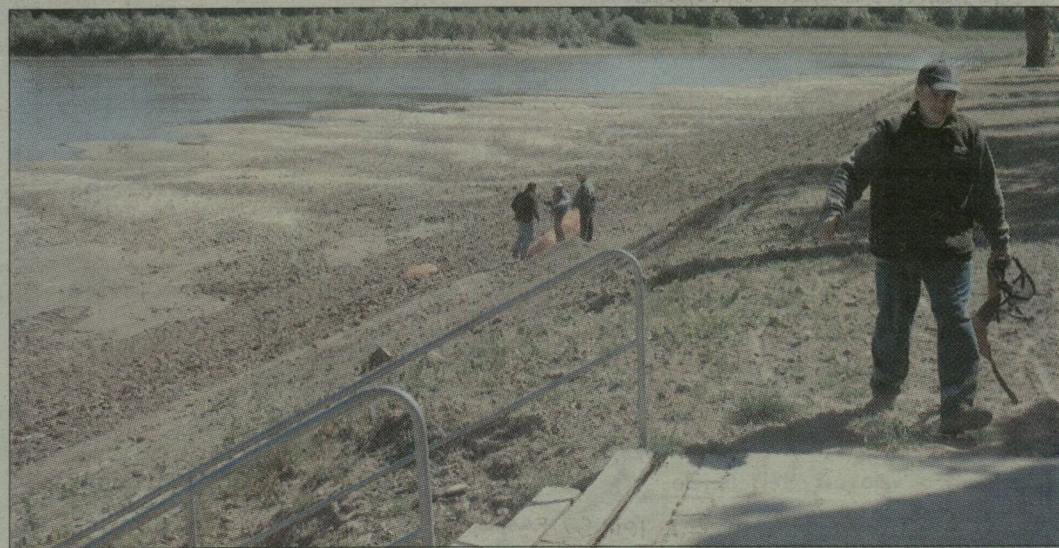
A homokpad is kidugta orrát a Tiszából, a kempingbe már kiránduló osztályokat várnak