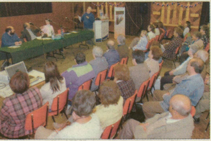
A falubeliek közül sokan eljöttek a művelődési házba