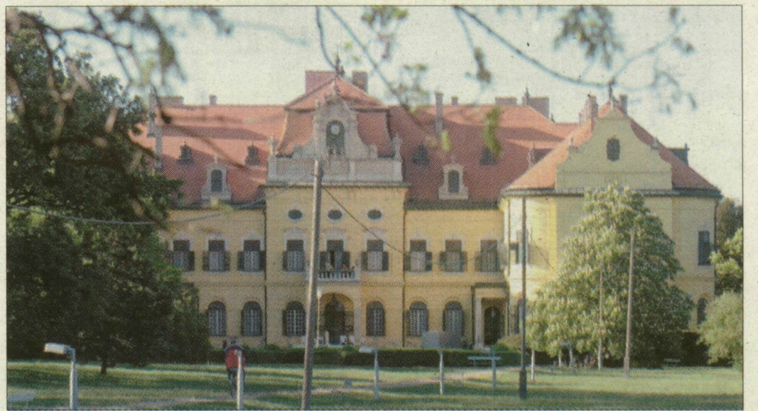
Az impozáns épületben ma betegeket ápolnak