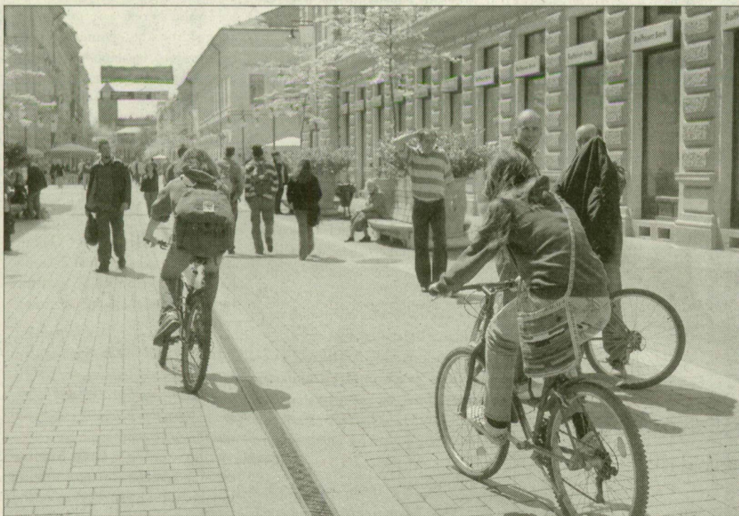
A kerékpárosok többsége áthajt a Kárász utcán is

Egyik olvasónk levelében azt írja, hogy kislányát egy negyven kilométeres sebességgel száguldó kerékpáros a szegedi Széchenyi téren majdnem elgázolta. A szabályok szerint a város főterén és a Kárász utcán sem lehet kerékpározni – bár ez egyértelműen nincs ki-táblázva. A tér és a sétálóutca két végén ugyan ott van a gyalogoszónát jelző tábla, de aki például a Kárász utcára a mellékutcákból, a Kölcseyből vagy a Kígyóból érkezik, az nem találkozik kerékpárosokat kitiltó táblával. Ugyanez a helyzet a Széchenyi térenél is, a posta felőli oldalon nincsenek gyalogoszónára felhívó táblák, csak a városháza felőli részen.