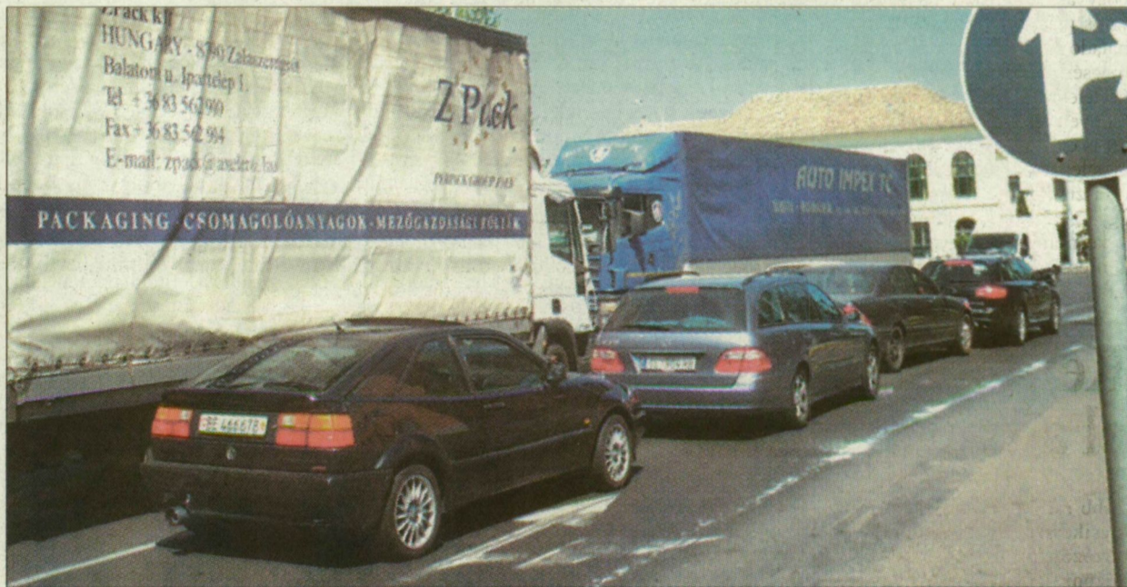
A napi két-három ezer, Makón áthaladó jármű füstje a belváros levegőjét „vastagítja”