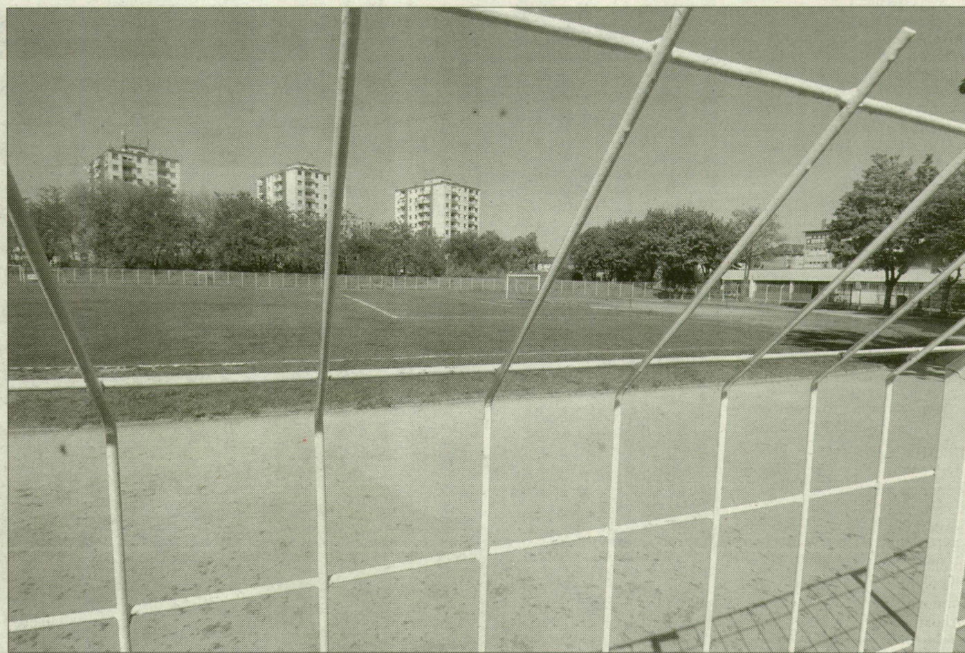
A Vasutas-stadion üzemeltetése épphogy csak nullszaldós, ezért az SZVSE a költözést fontolgatja