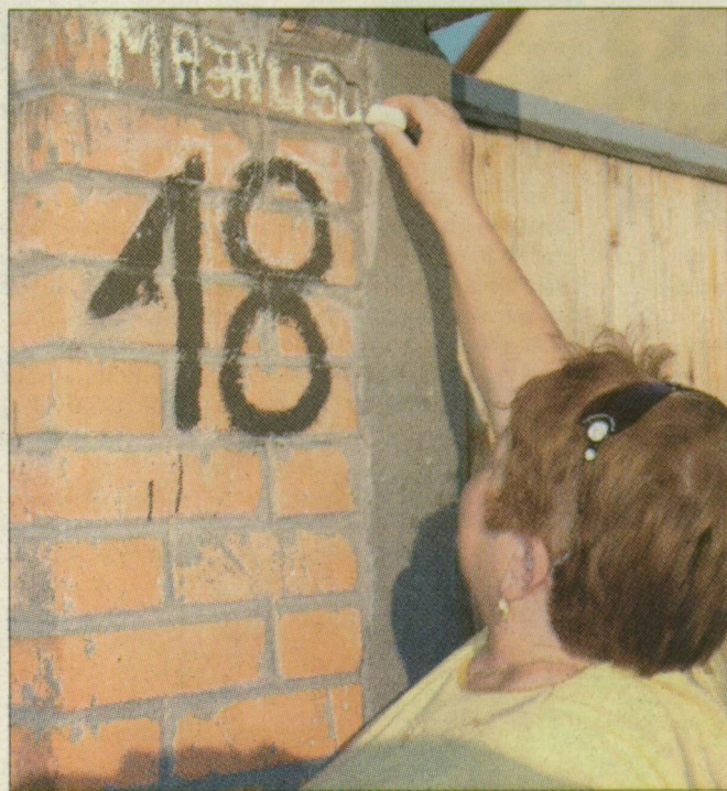
Ebbe az utcába vágyott gyerekkora óta

gondoltam, milyen jó lesz a mi gyerekeinknek itt felnőni, ahol még az úttesten is nyugodtan görkorcsolyázhatnak – magyaráz a fiatalasszony.