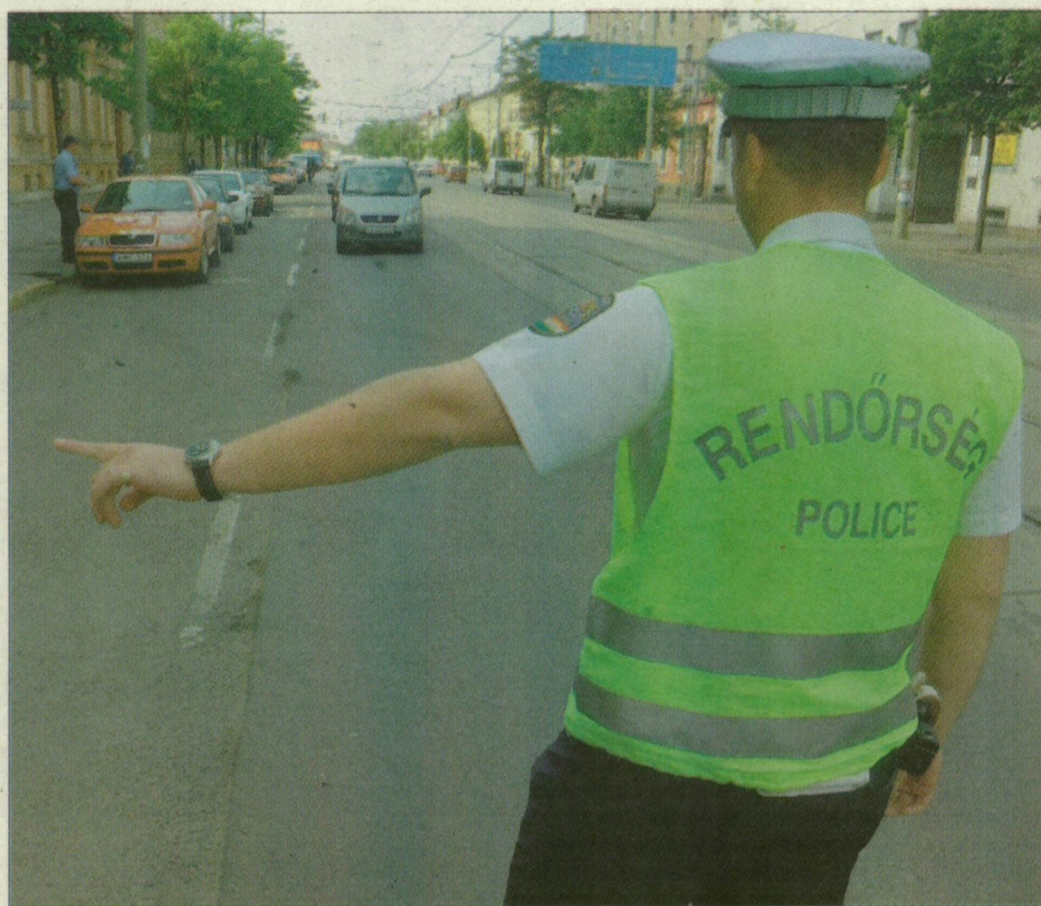
Májustól mindennapos látvány lesz az utakon a rendőri ellenőrzés

– A balesetek jelentős részénél az egyik ok a gyorsajtás. A mostani ellenőrzés csak annyiban különbözik a hasonló országos vagy helyi akcióktól, hogy az