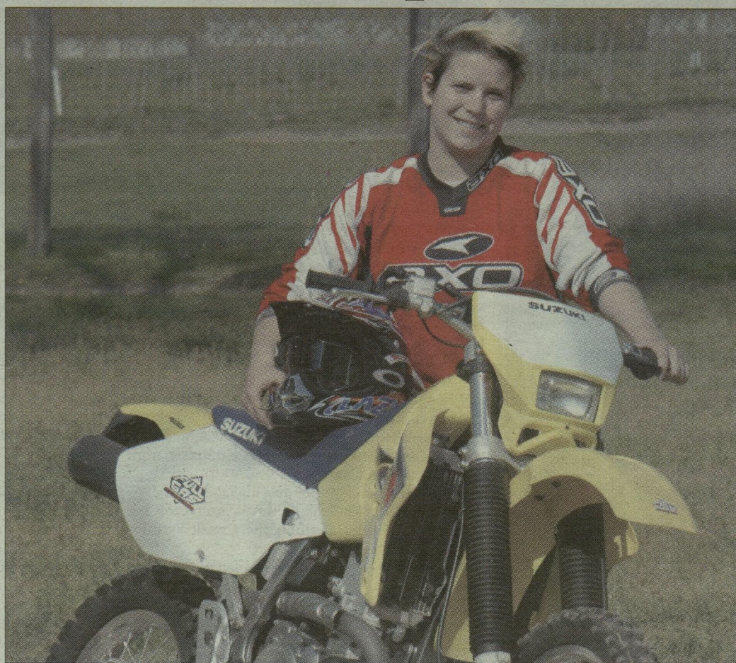
Risztov Éva már a krosszversenyekre „gyúr”