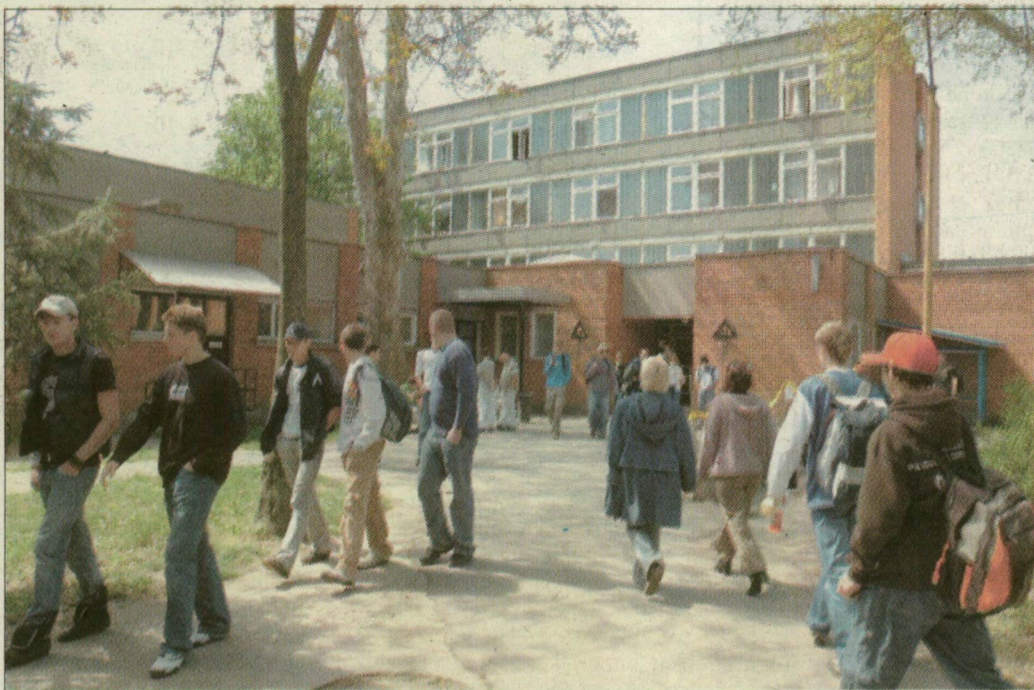
Nem csak a kollégiumot használják majd közösen: egy intézménnyé lesz a mostani Móra- és a Tápai-iskola

A szegedi közgyűlés februárban határozta el, hogy július 1-jei hatállyal összevonja a Móra Ferenc Szakközépfiskola, Szakiskola és Kollégiumot, valamint a Tápai Antal Szakközép- és Szakiskolát. A lépéshez pénzforrást nem rendelt az önkormányzat, vagyis az ide tervezett fejlesztéseket (például az országhoz már létező 16 térségi integrált szakképzési központhoz hasonlatos centrumot) a különböző pályázatokon elnyert támogatásokból reméli megvalósítani. Az összeolvasztás híre nem érte váratlanul e két intézményt. A Kálvária sugárúton, egymás szomszédságában dolgozó iskolák ugyanis – a korábbi rivalizálással szemben – évek óta együttműködnek. Nemcsak a kollégiumot és az ebédelőt használják közösen, hanem újabb szakmai téren is szoros a kapcsolat: mindkét iskola sikeresen pályázott a szakiskolai képzési programra, s példá-