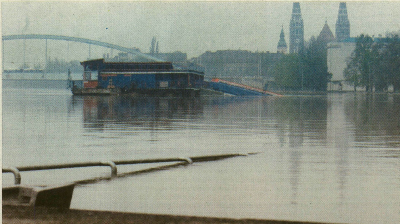
A Tisza egy évvel ezelőtt: Szegednél április 21-én tetőzött 1009 centivel. A védekezés három és fél, a helyreállítás pedig további négy és fél milliárd forintba került az Atikővizig területén

Próba Rendkívüli árvízvédelmi készültség tavaly 25 napig volt érvényben a Tiszán; az ezredvégi árvízkor csak húsz napig. A különböző fokozatú készültségeket összeadva – az első fokútól a rendkívülig – kiderül: tavaly nyolcvan napig, azaz csaknem három hónapig volt szükség fokozott árvízvédelmi készenlétre, míg 2000-ben csak ötvennyolc napig. tudott lefolyni a Dunába. A legélesebb helyzet a Körösöknel alakult ki, napról napra emelkedtek az előrejelzett vízmagasságok, és folyt a versenyfutás a vízzel: melyik ér el hamarabb na-