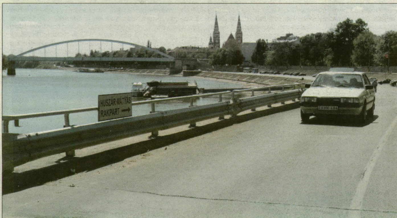
A Tisza ma: Szegednél 177 centiméter