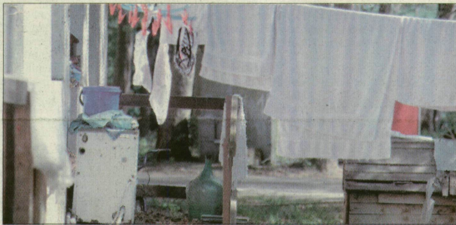
Itt szemlátomást lakik – valaki