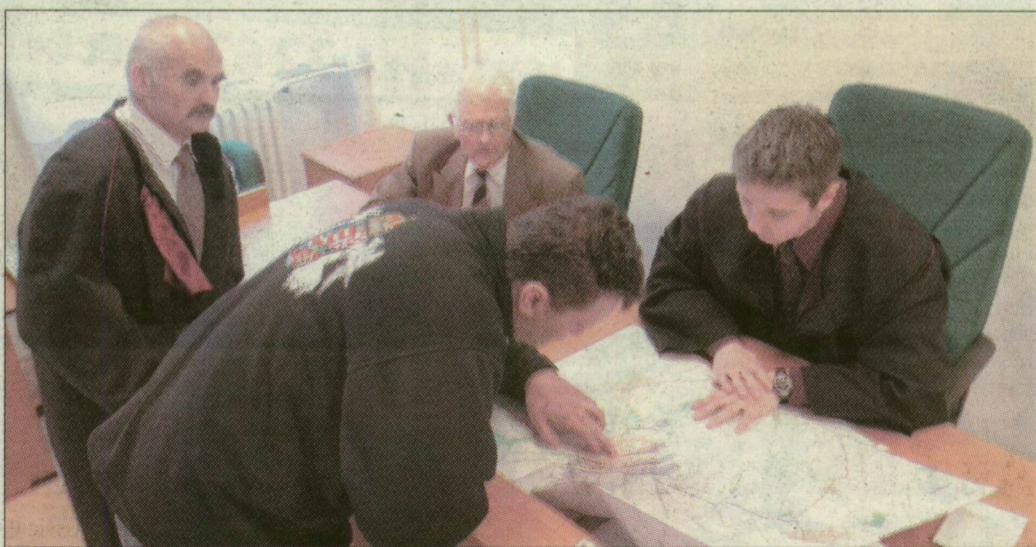
Bíróságon. A tanúként beidézt két horgász a térképen mutatta, hol fogták a halakat.

Pénzes Sándorné testvére, Heni nagybátyja, valamint lányuk jogi képviselője részt vesz a tár-