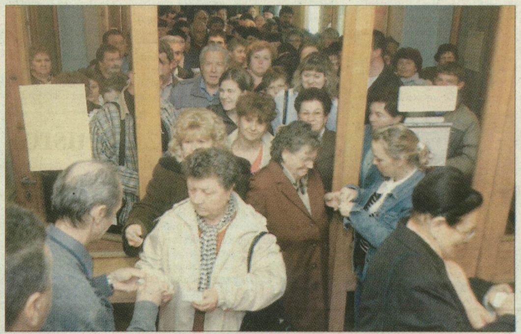
Már az elődöntőkön is óriási volt az érdeklődés lakodalmas fesztiválunk iránt. Pedig a java, a ma esti döntő még hátravan