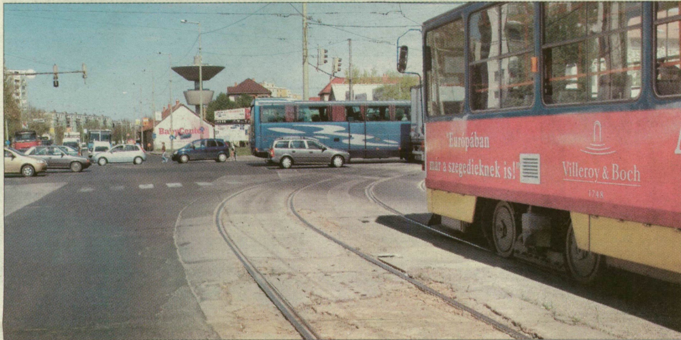
A Kossuth Lajos sugárútra kanyarodik a villamos. A vonal „kiegyenesítéséről” Brüsszelben döntenek