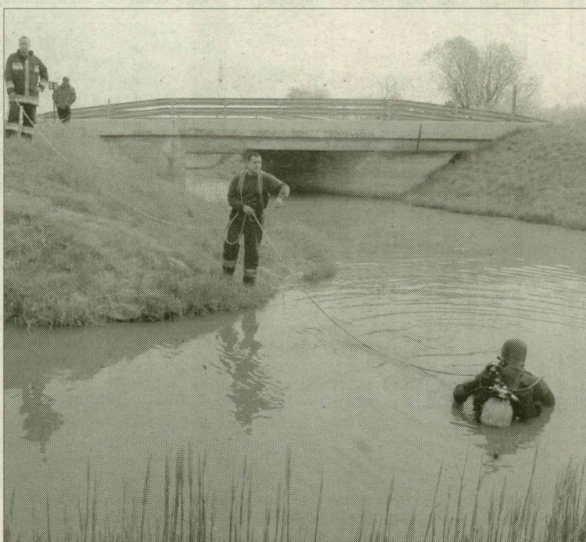
A szolgálaton kívüli szentesi tűzoltók is keresték a tóba esett sándorfalvi kisfiút

– Szentesen és környékén számos vízes élőhely van: a Tisza, a Kurca és a Körös. Több olyan balesetben dolgoztunk, ami akár tragédiával végződhetett volna. Például jó néhány évvel ezelőtt egy autó három utassal zuhant a Kurcába, és volt egy olyan eset is, amikor egy személygépkocsi a jég alá futott. Az autó utasai mindkét esetben ki tudtak szabadulni a járműből, mi viszont elgondolkodtunk azon: tudtunk volna segíteni, ha súlyosabb a helyzet? A tűzoltóságon belül búvárszolgálat felállítására nem volt és nincs pénzünk, viszont hét évvel ezelőtt