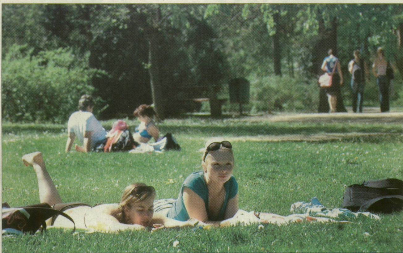
Az újszegedi ligetben is sokan napfürdőztek