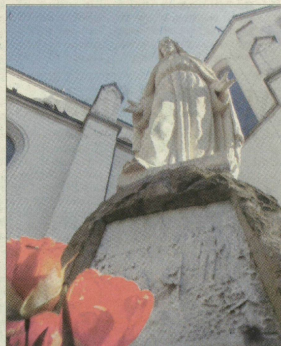
A szegedi Föltámadás utca a Rókusai templomhoz vezet. Virágok a Krisztus-szobor előtt

Írásaink a 3., 5. oldalon és a Sziesztában