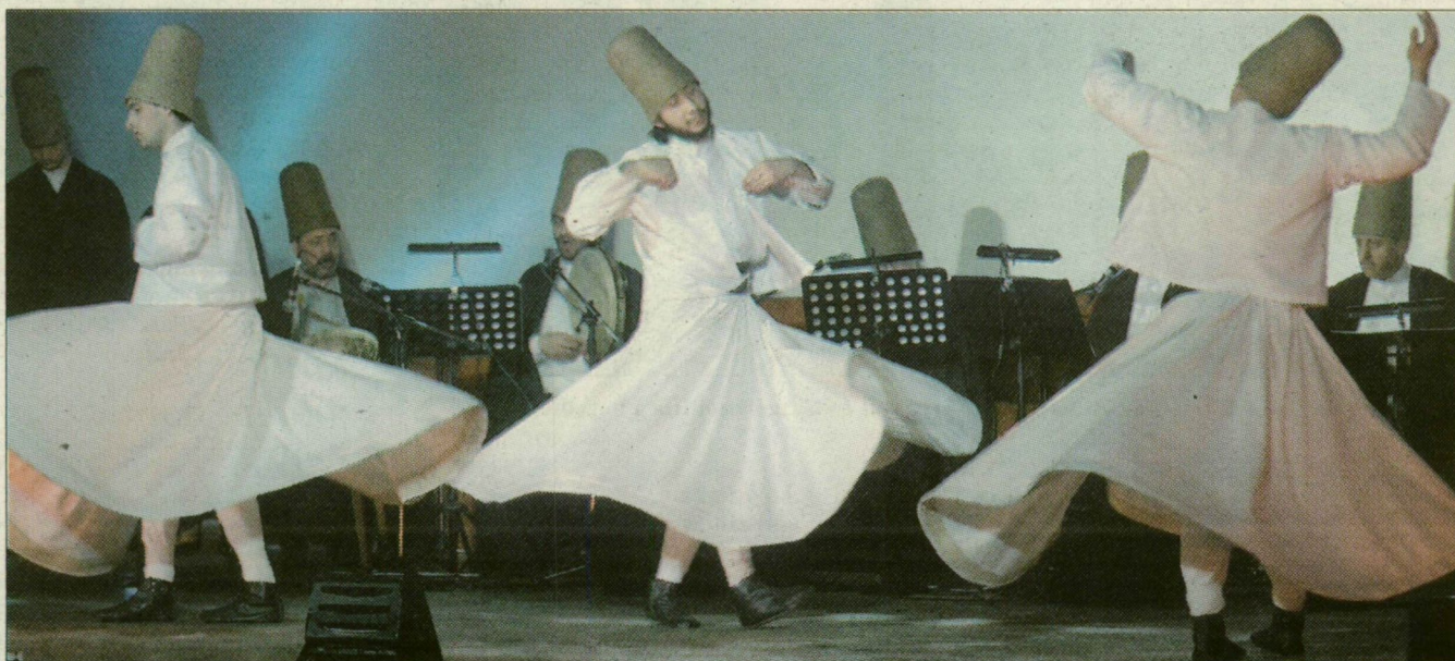
Extázisban a kerengő dervisek

Az UNESCO által az emberiség szellemi örökségének nyilvánított szema szertartást ismerhette meg a közönség Szegeden. Kedden este az érdeklődők tradicionális szüfi zenét hallgathattak a Belvárosi moziban, majd hat kerengő dervis táncát nézhették meg. A dervisek zenei kísérette folyamatosan forognak, kezüket és fejüket az ég felé tartják. Így extázisban élnek át, s felolvadnak Allahban. A telt ház esetében a török és magyar értelmiségiek, tudósok által alapított magyarországi Dialógus Platform Egyesület szervezte.