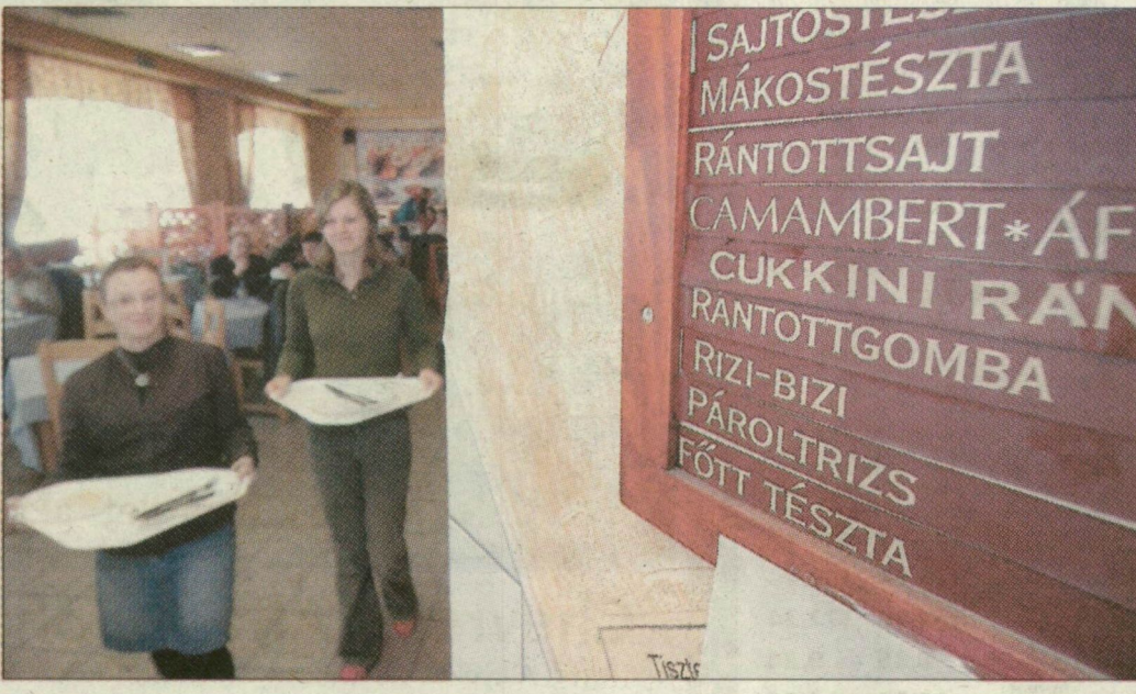
Aki akar, böjtölhet. Az éttermi ajánlatok között a húsmentes ételek is megtalálhatók