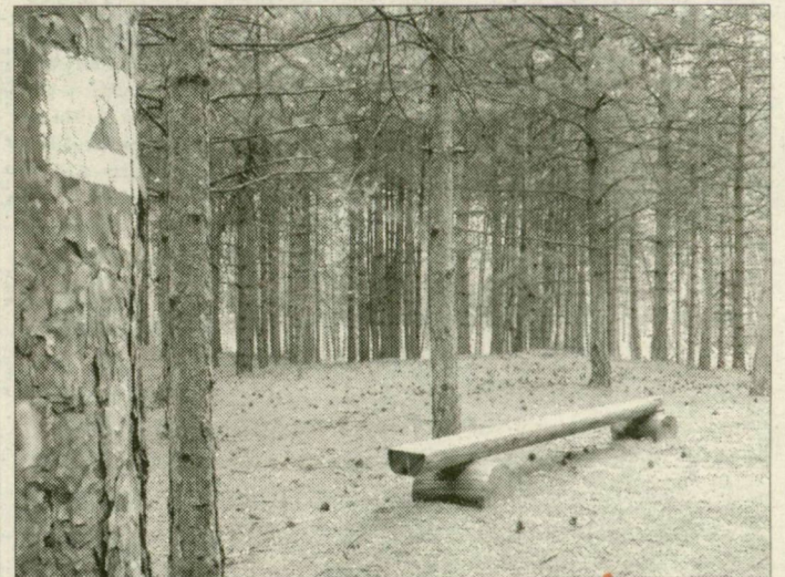
Ötömös, a megye legmagasabb pontja, amit turisták is gyakran fölkeresnek, szerencsére kevésbé fertőzött terület

■ Miért nem kísérleteznek az erdeszek más, a fenyőnél kevesebb, vagy legalábbis kezelhetőbb kártevőt vonzó fajakkal? Azért, mert ilyenek nem nagyon vannak. A száraz talajú homokvidékek legnagyobb részén a gazdaságilag hasznosítható fák közül kizárólag a fenyő él meg: ezen belül is az erdei és a fekete. Választani kell, vagy semmi nem kerül ide, vagy a fenyves – és erdőgazdálkodási szempontból az utóbbi a kedvezőbb.