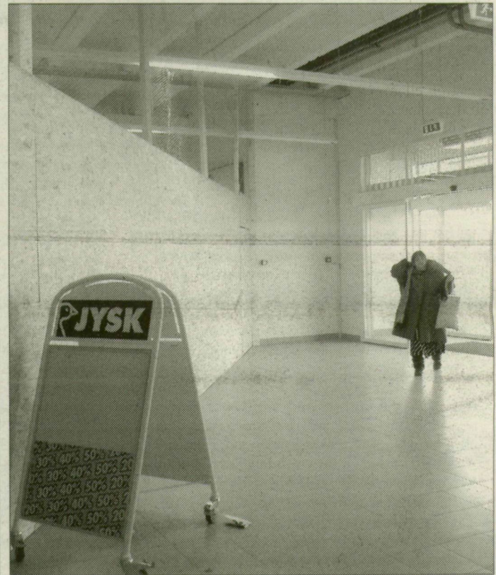
Fél év után is üres az alsó szint