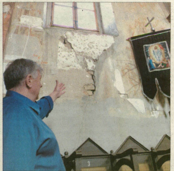
A szerb ortodox egyháztól várják a segítséget a szőregiek. Három hónap alatt elvégezhető lenne a munka