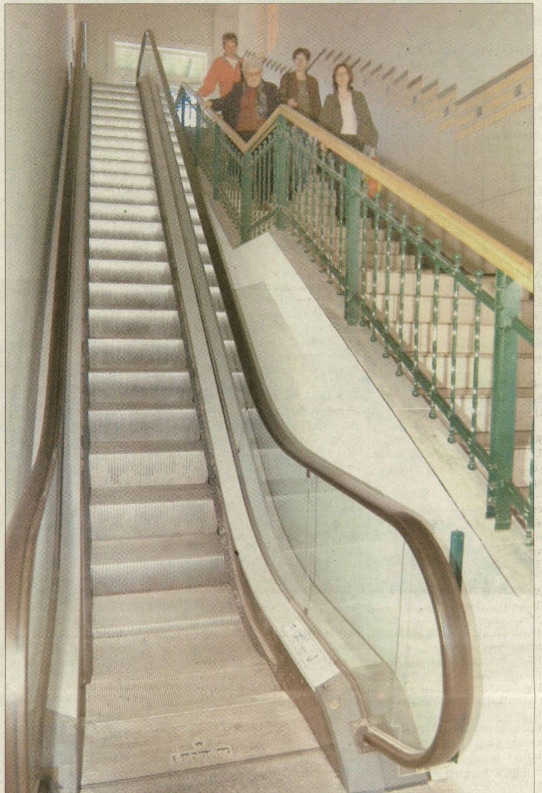
Az utasok még nem használhatják a mozgólépcsőt