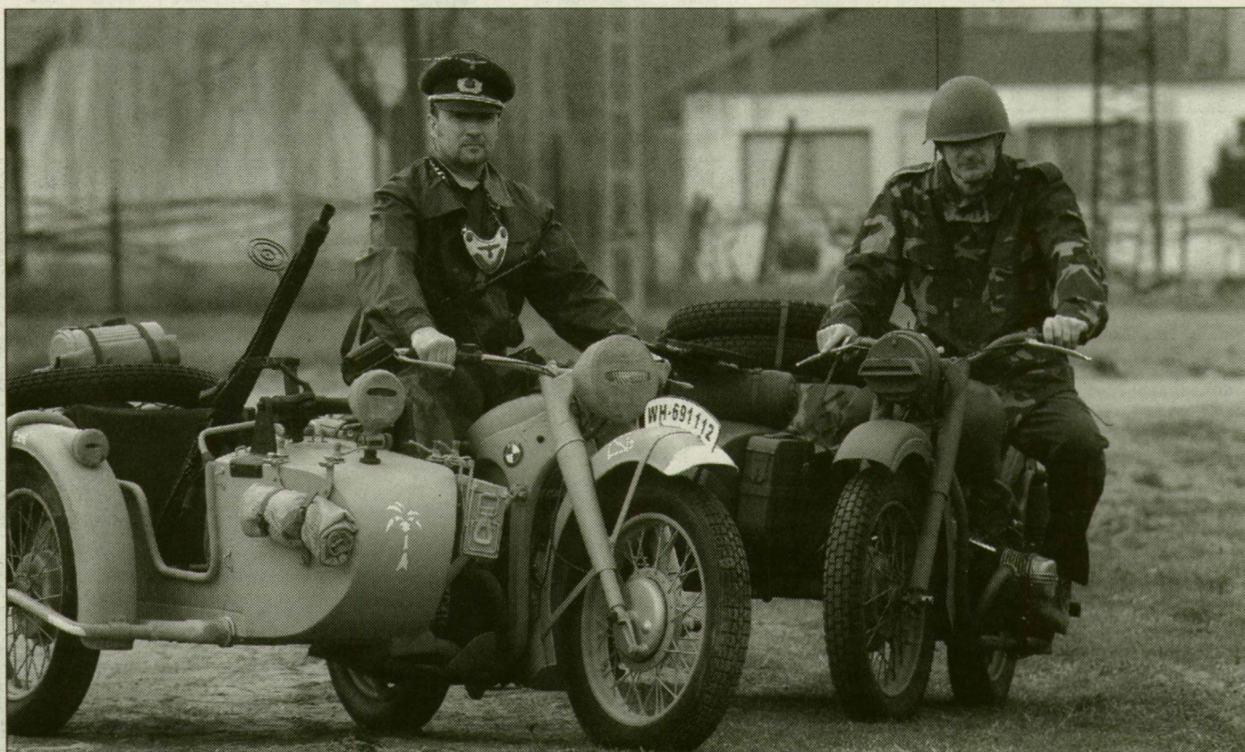
Oldalkocsisok. A német BMW és az orosz Ural M63-as