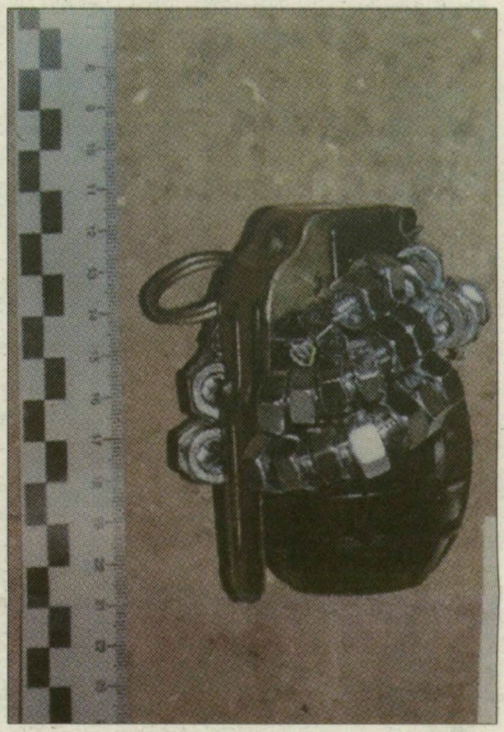
Egy kézigránát a számos lefoglalt fegyver közül Folytatás az 5. oldalon