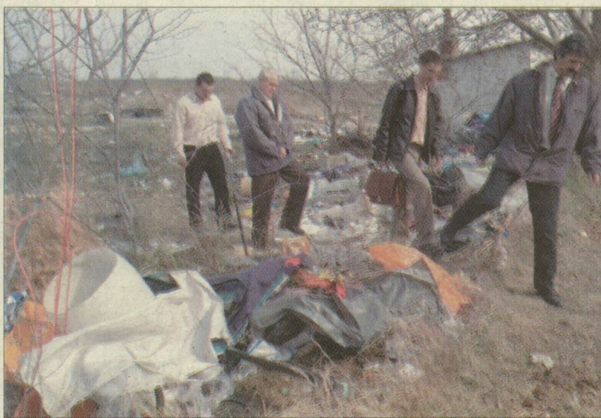
Kisteleken nincs őrzés és kerítés, de sok az illegálisan behordott szemét