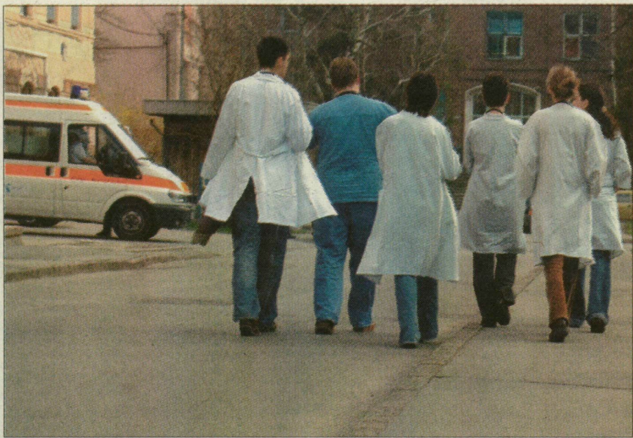
Az elbocsátás csak az egyik lépése lehet a megszorító csomagnak