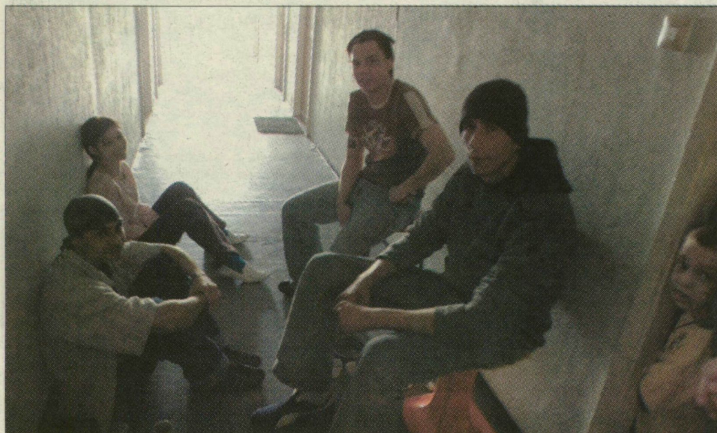
Cigi, kávé, haverok. Klubélet a garzonház egyik folyosóján