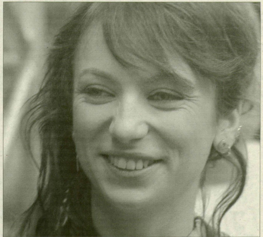
Rúzsza Magdi még nem tudja, mit ad elő a fesztiválon

Aki szeretné Rúzsza Magdit hallani, annak nem kell az eurovíziós dalfesztivál május 10-i televíziós közvetítéséig várnia. A vajdasági lány holnap este 8 órától Szegeden ad több mint kétórásra tervezett nőnap koncertet a Mars téri U pavilonban.