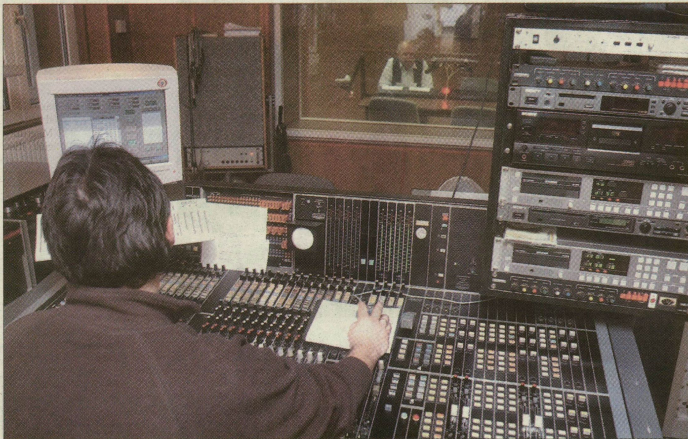
Stúdió. A szegedi közszolgálati rádió épületében mindössze húszan dolgoznak