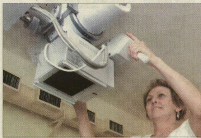
A röntgen veszélyes üzem